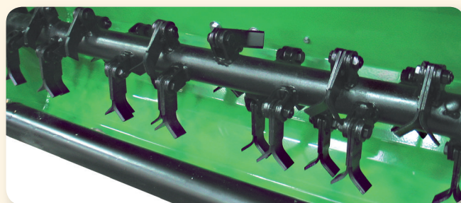
Vista albero coltelli / Flail shaft view. / Vue du rotor / Messerwelle foto

Facile Tensione cinghie Easy belts tightening adjustment. Tensionnement facile des courroies Einfache Spannungs-Kontrolle der Keilriemen