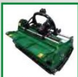
APERTURA POSTERIORE PER ISPEZIONE REAR OPENING FOR INSPECTION