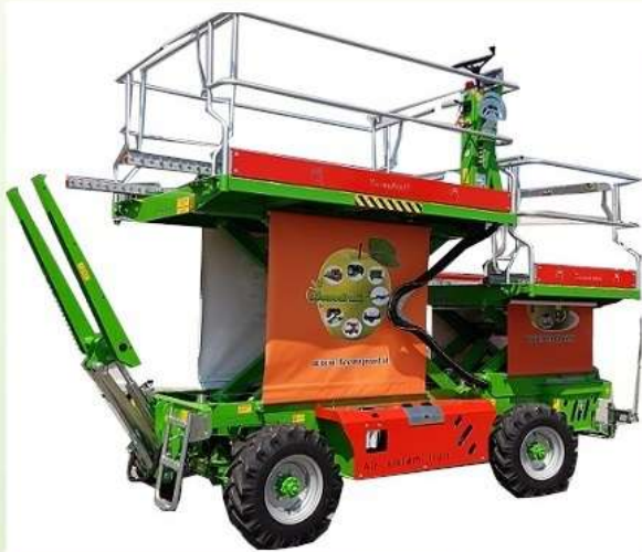
Doppia piattaforma elevabile Double lifting platform

Self-propelled fruit produced on request