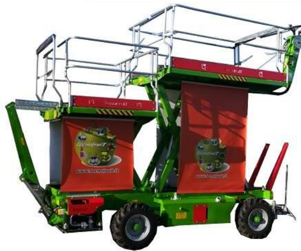
Doppia piattaforma: 1 fissa e 1 elevabile